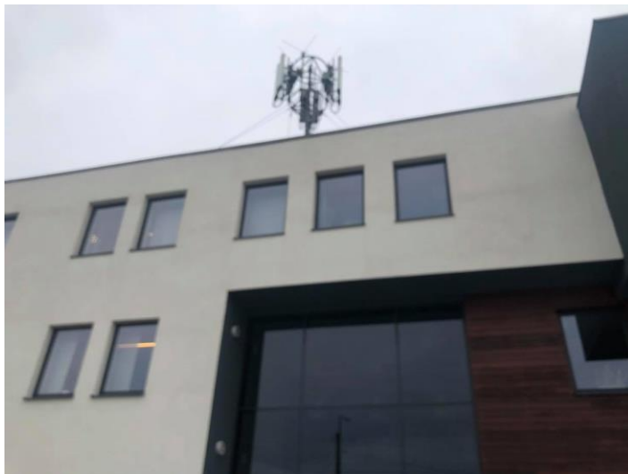
Zař. nr 1: Widok ogólny instalacji radiokomunikacyjnej.