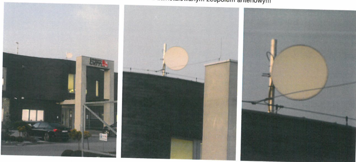
Widok obiektu wraz z zainstalowanym zespołem antenowym