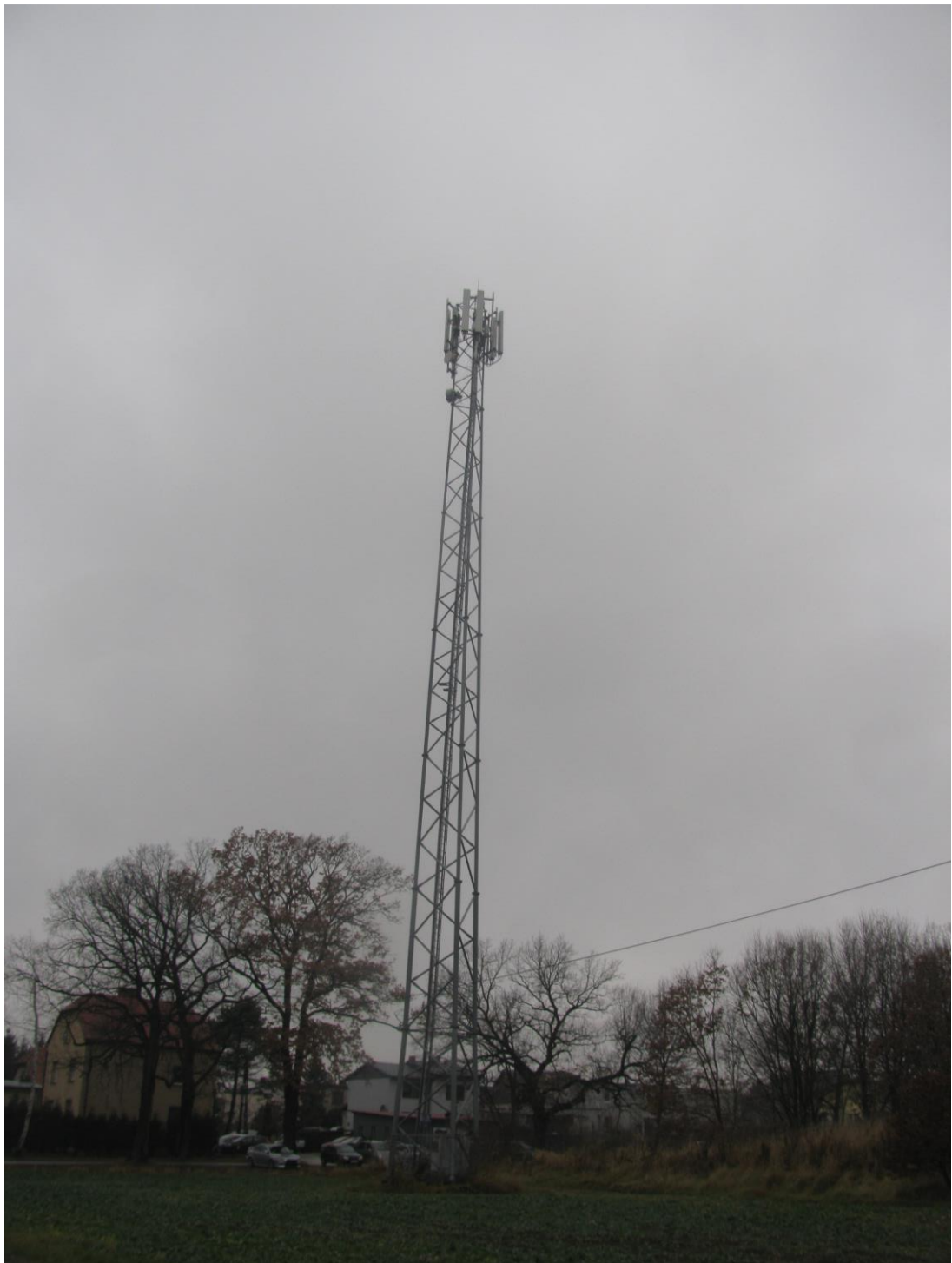
Zat. nr 1: Widok ogólny instalacji radiokomunikacyjnej.