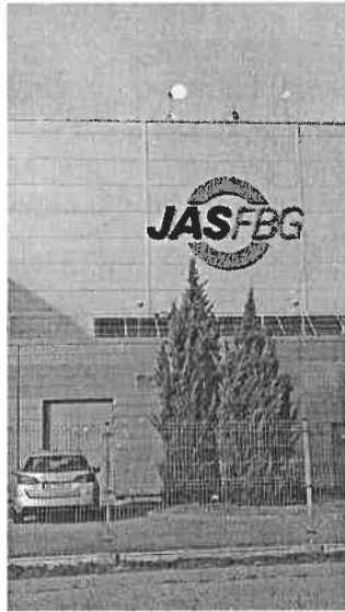
Widok obiektu wraz z zainstalowanym zespołem antenowym